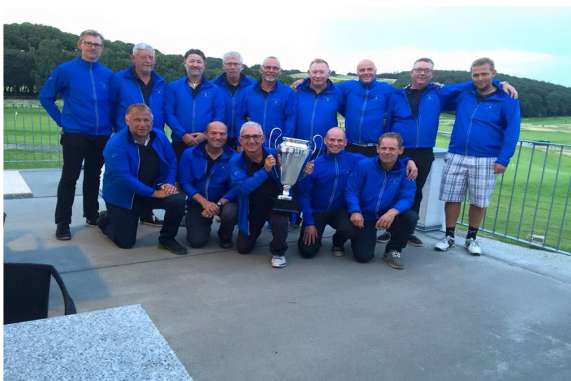
Holdet bag vores første og desværre eneste sejr i 2015.