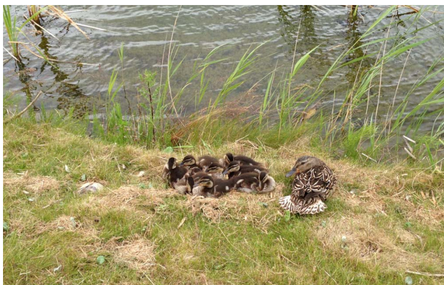
B1 - golf og dyreliv

Afbud skal ske direkte på Golfbox inden fire timer før første fligth's start. Ellers skal den ske til matchlederen, hvis telefonnummer vil fremgå af matchproportionerne.